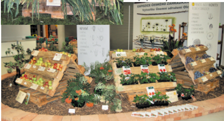
Expozice ČZS na Výstavě Flora Olomouc 2015 - letní etapa