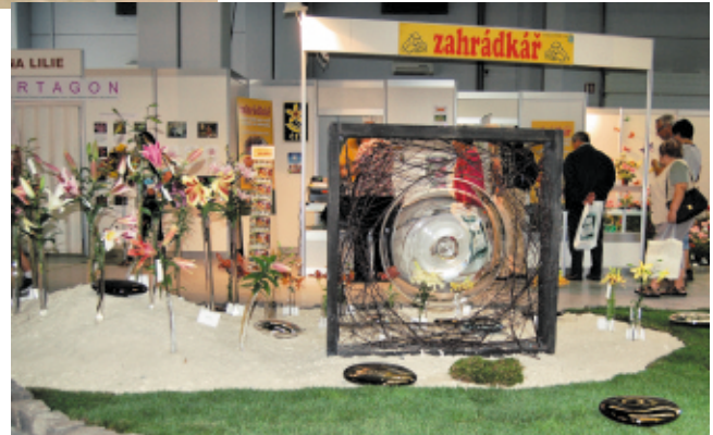
Stánek časopisu Zahrádkář je již neoddělitelnou součástí svazových výstav.