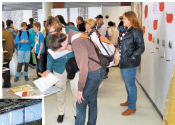
Expozice ČZS na jarní Floře „Zahrádka dá smysl vašim smyslům“ byl v obležení návštěvníků. Hlavní výstavní pavilon byl prostorově vymodelován pomocí dřevěných palet včetně barevně nasvětleného tunelu skrz paletový komplex.

V celé ČR se v průběhu roku prezentují zahrádkáři na stovkách výstav. Největší počet je těch výstav, které připravují jednotlivé ZO a též SZO zahrádkářského svazu na místní úrovni. Vedle těchto výstav pořádají výstavy některá územní sdružení. Velké, reprezentativní výstavy se pořádají pod hlavičkou Krajských koordinačních rad a zpravidla i za pomoci představitelů státní správy. K těmto výstavám by měli promluvit jejich organizátoři, jejich zkušenosti by mohli využít všude tam, kde se do výstav chtějí pustit a zatím ještě z různých důvodů váhají.